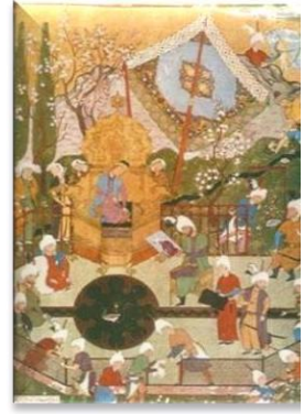
Şəkil № 1

mövzuya maraq ancaq XVII yüzildən sonra artmışdır. Başqa sözlə desək, klassik miniatür lövhələrində, bir qayda olaraq təbiət fonunda yerləşdirilən insan fiqurları təbiətin və kainatın birzərrəsi tək qavranılmışdır” [3, s. 12]. Bu səbəbdən Şərqin nəqqaşları insan fiqruna, heyvan və ya mənzərə təsvirində olduğu kimi eyni yanaşılmış və insan fiqurunun daha qabarıq formada təsvirinə üstünlük verilməmişdir.