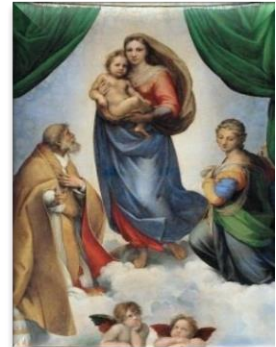
Şəkil № 3

Ərəb hərflərindən ibarət insan çöhrəsi və xəttatlıqda müqəddəs adlardan tərtib