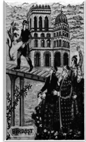
Şəkil № 5

ornamentallığın özünəməxsus xüsusiyyətlərini formalaşdıran əsas səbəblər islam dininin olması, şərqlə mədəniyyətinin bir hissəsini təşkil etməsi və coğrafi mövqeyidir. Dünya mədəniyyəti tarixində Qərbin Şərqlə, eləcə də Şərqlə Qərbə təsirini daim müşahidə etmək mümkündür. Bu ornamentika sahəsində də özünü göstərmişdir.